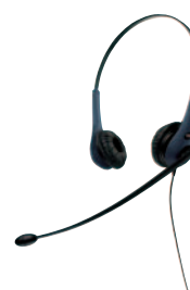
GN 2200 duo (blå)

Om du inte redan vet vad perfekt telefonkomfort är, kommer du att förstå det när du provar GN 2200. Du kanske till och med glömmet att du talar i telefon, eftersom du får en känsla av samtal öga mot öga. Gör dig beredd att ta steget till högre effektivitet och en färgsprakande upplevelse!