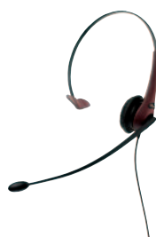
GN 2200 mono (rött)