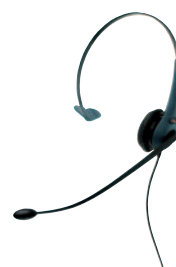
GN 2200 mono (grön)