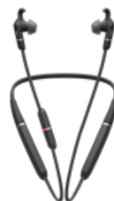
Jabra Evolve 65e MS