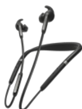
Jabra Elite 65e - Titanium Black