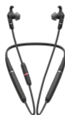
Jabra Evolve 65e UC