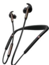
Jabra Elite 65e - Copper Black