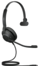
Jabra Evolve2 30 SE USB-C, UC Mono