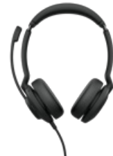
Jabra Evolve2 30 SE USB-A, UC Stereo