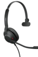
Jabra Evolve2 30 - USB-A UC mono