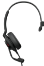
Jabra Evolve2 30 SE USB-A, UC Mono