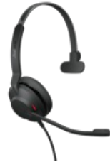
Jabra Evolve2 30 SE - USB-C/A, UC Mono