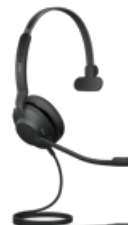
Jabra Evolve2 30 - USB-C UC mono