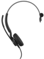
Jabra Engage 40 - (Inline Link) USB-A