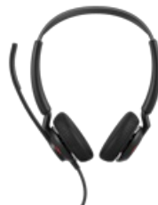
Jabra Engage 50 II - USB-A UC Stereo