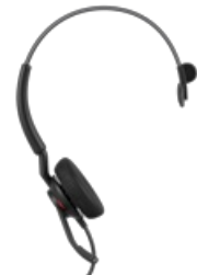
Jabra Engage 40 - (Inline Link) USB-C/A