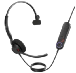
Jabra Engage 40 - (Inline Link) USB-C