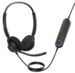
Jabra Engage 40 - (Inline Link) USB-A