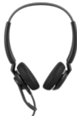
Jabra Engage 40 - (Inline Link) USB-C