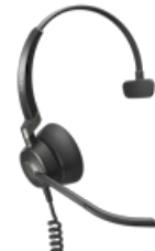
Jabra Engage 50 Mono