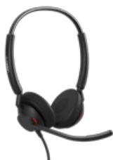
Jabra Engage 40 - (Inline Link) USB-C/A