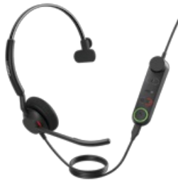
Jabra Engage 50 II - (Engage 50 II Link)