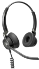
Jabra Engage 50 Stereo