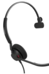
Jabra Engage 50 II - USB-A UC Mono