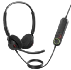
Jabra Engage 40 - (Inline Link) USB-A