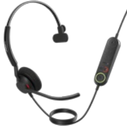
Jabra Engage 40 - (Inline Link) USB-A