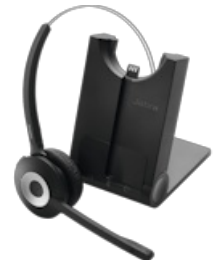
Jabra Pro 930 Mono