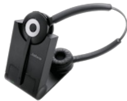
Jabra Pro 930 Duo