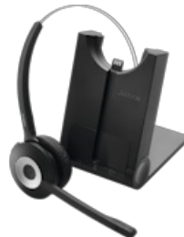
Jabra Pro 930 MS