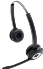
Jabra Pro 920 Duo