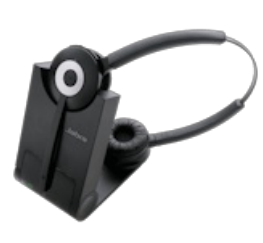
Jabra Pro 930 Duo