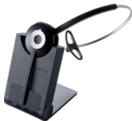
Jabra Pro 920 Mono