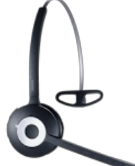
Jabra Pro 930 Mono