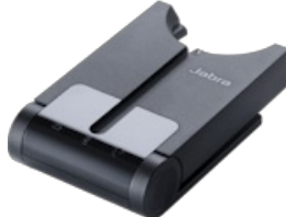
Jabra Pro 930 MS