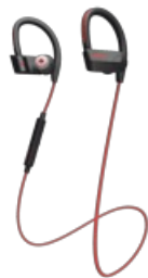
Jabra Sport Pace Wireless