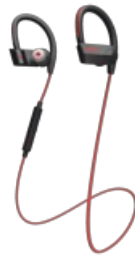
Jabra Sport Pace Wireless