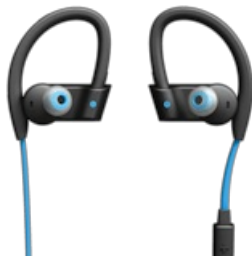
Jabra Sport Pace