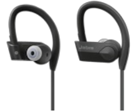
Jabra Sport Pace Wireless Black