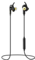
Jabra Sport Pulse Wireless