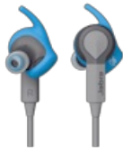
Jabra Sport Coach