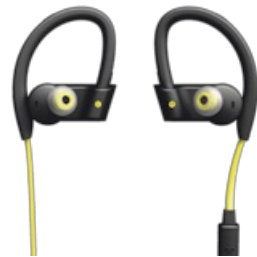
Jabra Sport Pace