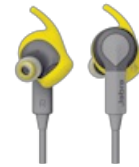
Jabra Sport Coach