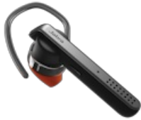
Jabra Talk 45 - Silver