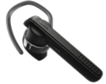
Jabra Talk 45 - Black