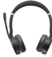
Jabra Evolve 75 SE - UC Stereo with