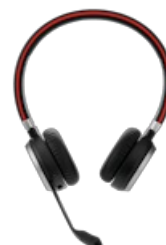
Jabra Evolve 65 SE - UC Stereo with