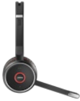
Jabra Evolve 75+ UC Stereo