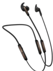
Jabra Elite 45e - Copper Black