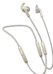
Jabra Elite 45e - Gold Beige