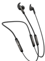
Jabra Elite 45e - Titanium Black