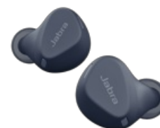
Jabra Elite 4 Active - Marino