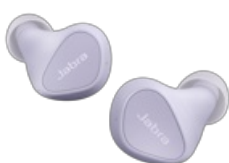
Jabra Elite 3 - Lilac