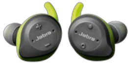
Jabra Elite Sport (Lime Green Grey)