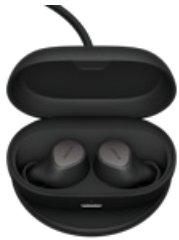
Jabra Elite 7 Pro - Titanium Black