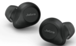
Jabra Elite 85t - Black