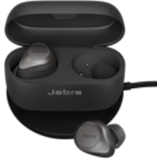
Jabra Elite 85t - Titanium Black