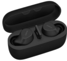
Jabra Evolve2 Buds - USB-A UC