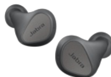
Jabra Elite 3 - Dark Grey