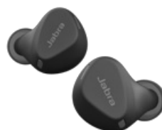
Jabra Elite 4 Active - Negro