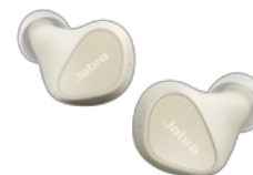
Jabra Elite 3 - Light Beige