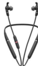
Jabra Evolve 65e UC