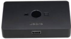
Jabra Link 950 USB-A