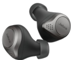
Jabra Elite 75t - Titanium Black