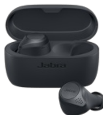
Jabra Elite Active 75t - Grey