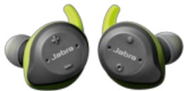
Jabra Elite Sport (Lime Green Grey)