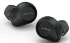
Jabra Elite 85t - Black