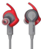
Jabra Sport Coach