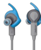
Jabra Sport Coach