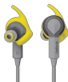
Jabra Sport Coach Wireless