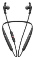
Jabra Evolve 65e UC