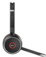
Jabra Evolve 75+ UC Stereo