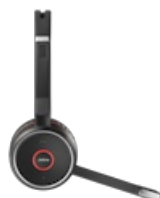
Jabra Evolve 75+ MS Stereo