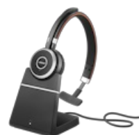
Jabra Evolve 65 SE - UC Mono with