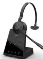
Jabra Engage 65 SE - Mono