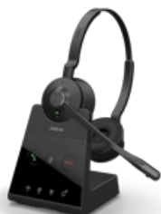
Jabra Engage 65 SE - Stereo