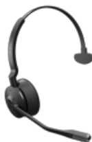
Jabra Engage 65 Mono