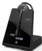
Jabra Engage 65 SE - Convertible