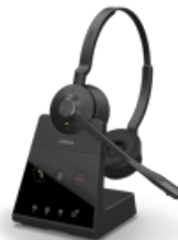
Jabra Engage 65 Stéréo