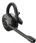
Jabra Engage 65 Convertible