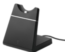
Jabra Evolve 65 SE - UC Stereo with