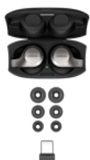
Jabra Evolve 65t UC