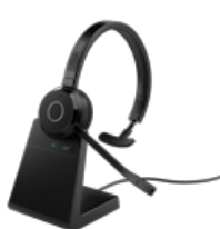
Jabra Evolve 65 TE - USB-A MS Mono