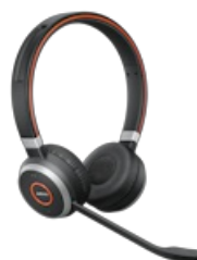
Jabra Evolve 65 SE UC Stereo