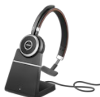
Jabra Evolve 65 SE - UC Mono with