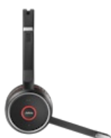
Jabra Evolve 75+ UC Stereo