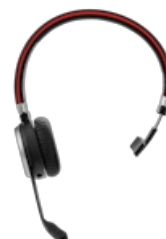
Jabra Evolve 65 SE UC Mono