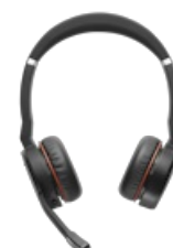
Jabra Evolve 75 SE - UC Stereo with