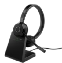
Jabra Evolve 65 TE - USB-A MS Stereo