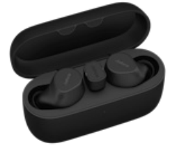
Jabra Evolve2 Buds - USB-C UC