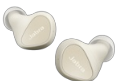
Jabra Elite 3 - Light Beige