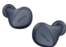
Jabra Elite 3 - Navy