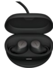
Jabra Elite 7 Pro - Titanium Black