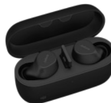
Jabra Evolve2 Buds - USB-A MS - Wireless