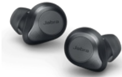
Jabra Elite 85t - Grey