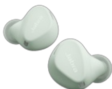
Jabra Elite 4 Active - Mint