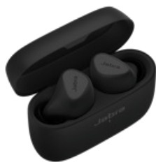
Jabra Connect 5t - Titanium Black