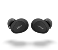
Jabra Elite 10 - Matte Black