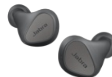
Jabra Elite 3 - Dark Grey