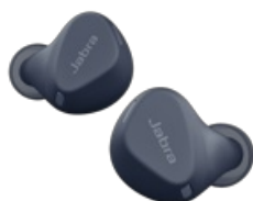
Jabra Elite 4 Active - Bleu