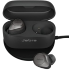
Jabra Elite 85t - Titanium Black