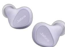
Jabra Elite 3 - Lilac