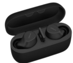
Jabra Evolve2 Buds - USB-A UC