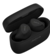
Jabra Elite 5 - Black