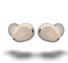
Jabra Elite 10 - Cream