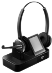
Jabra Pro 9465 Duo