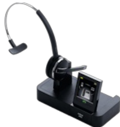
Jabra Pro 9470 Mono