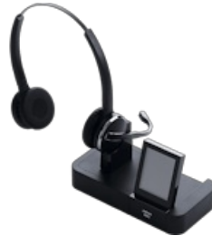
Jabra Pro 9460 Duo