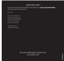
Jabra Motion Office