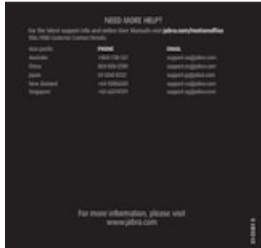
Jabra Motion Office MS