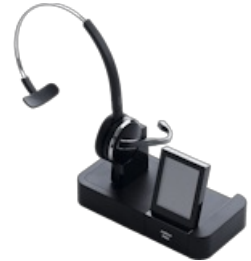
Jabra Pro 9460 Mono