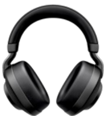
Jabra Elite 85h - Titanium Black