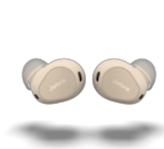
Jabra Elite 10 - Cream