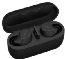
Jabra Evolve2 Buds - USB-A UC