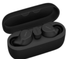
Jabra Evolve2 Buds - USB-C UC