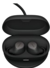
Jabra Elite 7 Pro - Titanium Black