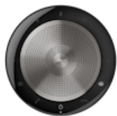
Jabra Speak 750 - MS Teams