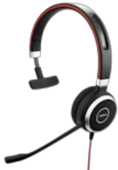
Jabra Evolve 40 UC Mono USB-C