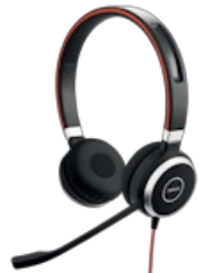
Jabra Evolve 40 UC Stereo USB-C