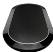
Jabra Speak 810 UC