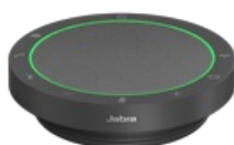
Jabra Speak2 55 MS Teams - Dark Grey