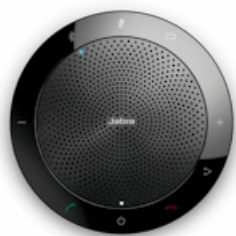
Jabra Connect 4s - USB-A