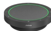
Jabra Speak2 55 UC - Dark Grey