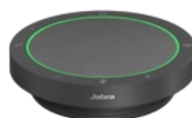
Jabra Speak2 40 - UC, Dark Grey