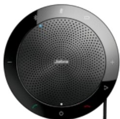
Jabra Speak 510 UC