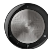
Jabra Speak 750 - MS Teams