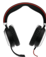
Jabra Evolve 80 UC Stereo USB-C