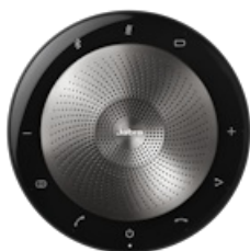
Jabra Speak 710 UC