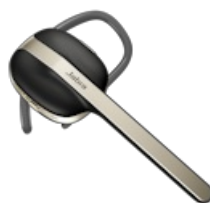
Jabra Talk 30