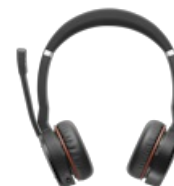
Jabra Evolve 75 SE - MS Stereo