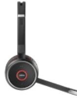
Jabra Evolve 75+ MS Stereo