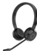
Jabra Evolve 65 TE - USB-A UC Stereo