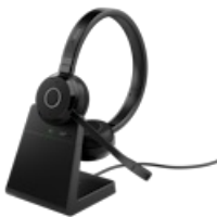
Jabra Evolve 65 TE - USB-A UC Stereo