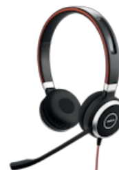
Jabra Evolve 40 UC Stereo